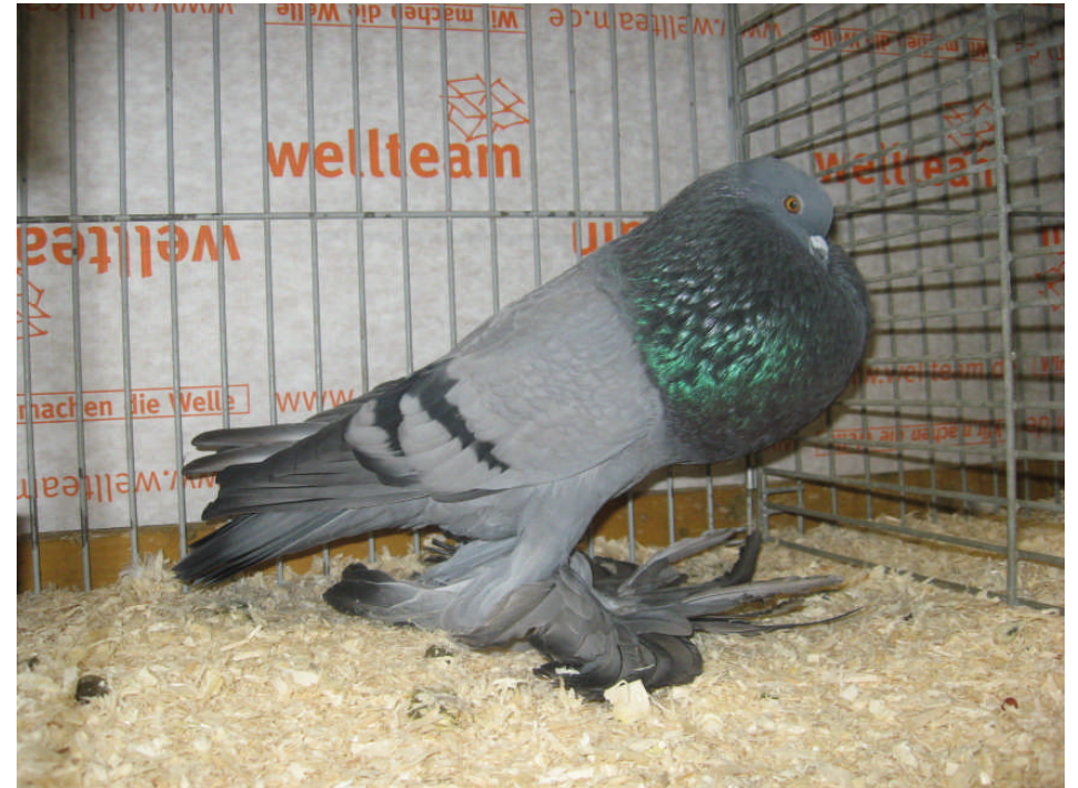
Clubshow 2010 Leeuwarden; mooiste ander geslacht van Tjeerd Bolding.

Het bestuur wenst jullie allemaal een uitstekend fokseizoen !