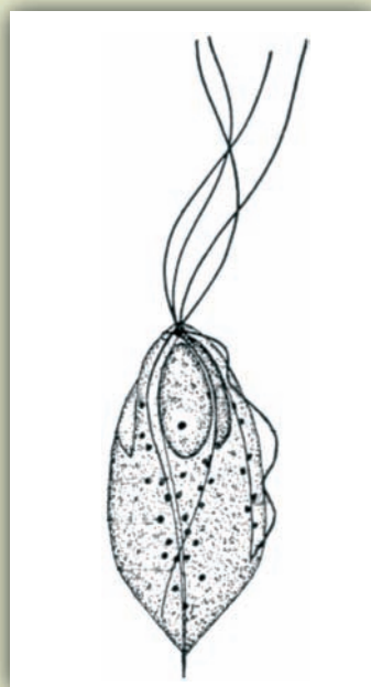
Tekening van Trichomonas: aan de bovenzijde de trilharen waar het zich met voortbeweegt.

Trichomonas gallinae komt wereldwijd voor en niet alleen bij duiven (Columba livia). Ook bij de oorspronkelijke duivensoorten en wilde duivensoorten (houtduif, tortelduif etc.) komen deze eencellige