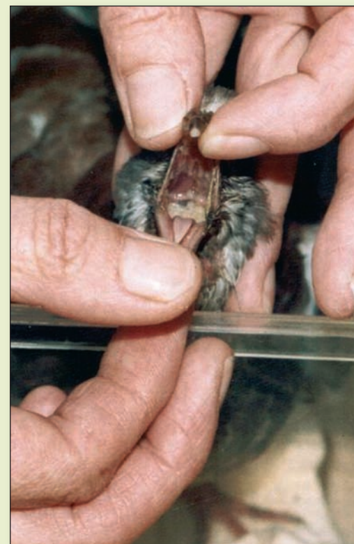
Door het openen van de bek van een jonge duif zijn achterin gele woekeringen zichtbaar.

Het is niet altijd eenvoudig de onderliggende oorzaak te vinden, maar er zijn wel enkele omstandigheden (factoren) te bedenken waarop de kans van een geelinfectie duidelijk toeneemt.