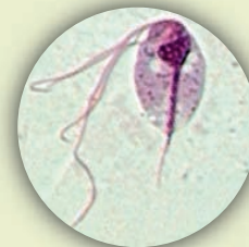
De Trichomonaden zijn eenvoudig onder een lichtmicroscop waarneembaar.

Het beeld van 'Het Geel' is bij de meeste duivenmensen wel bekend. Het kan variëren van een iets te rode keel plus een paar kleine gele puntjes op het achterste gedeelte van het verhemelte tot grote gele