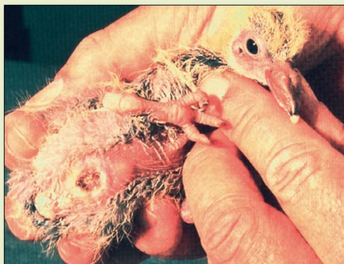
'Het Steen': een harde geelinfectie onder de huid rond de navel, alleen bij nestjongen.

Tot één van de ziekten die het meest wijdverspreid in onze duivenpopulatie voorkomt en waar waarschijnlijk iedereen wel eens mee te maken heeft gehad, kunnen we zeker Trichomoniasis rekenen. Deze ziekte, in de volksmond beter bekend als 'Het Geel', kent twee verschijningsvormen: namelijk de 'keelvorm' en de 'navelvorm', respectievelijk 'Het Geel' en 'Het Steen'. De ziekte kan ook verder doordringen tot in de inwendige organen zoals de lever. Als dat gebeurt, is de duif meestal niet meer te redden.