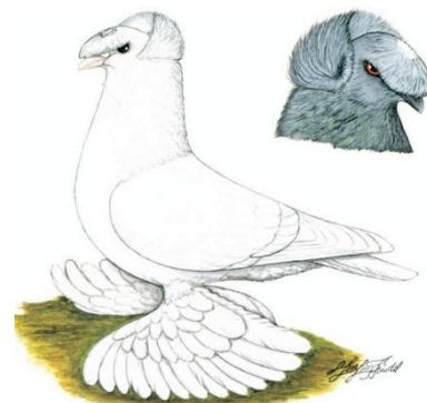
Duitse dubbelgekapt trommelduif